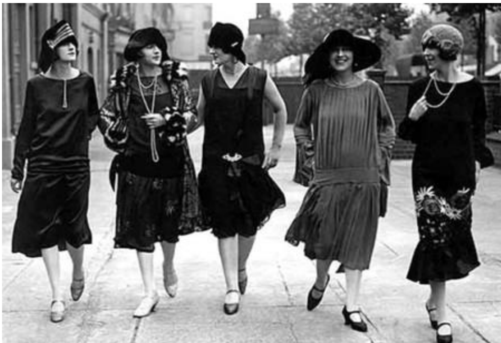
1.2) Novamente as golas bem mais baixas e as saias na altura da metade da panturrilha, com sapatos mais abertos.