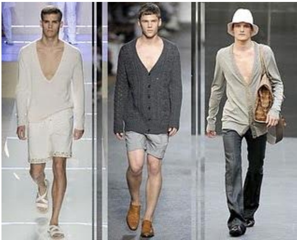
8.3 Estilo de passarela brasileira moda masculina nos anos 80.