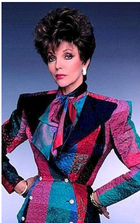
8.1 Cores e estilo de corte nos anos 80

8.Exemplos de moda e padrão de beleza nos anos 80.