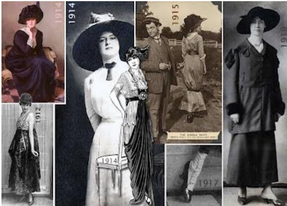
1.1) Cores escuras, golas mais baixas, vestidos na altura do tornozelo e a falta de corsets.