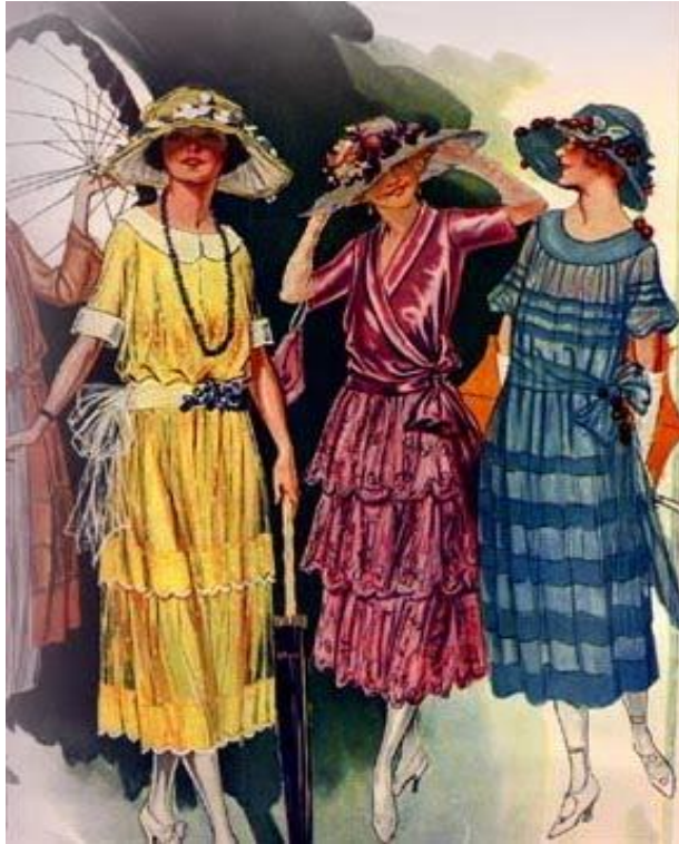
2.1) Vestidos em forma tubular, alcançando metade da panturrilha e chapéus combinados com os cabelos curtos.