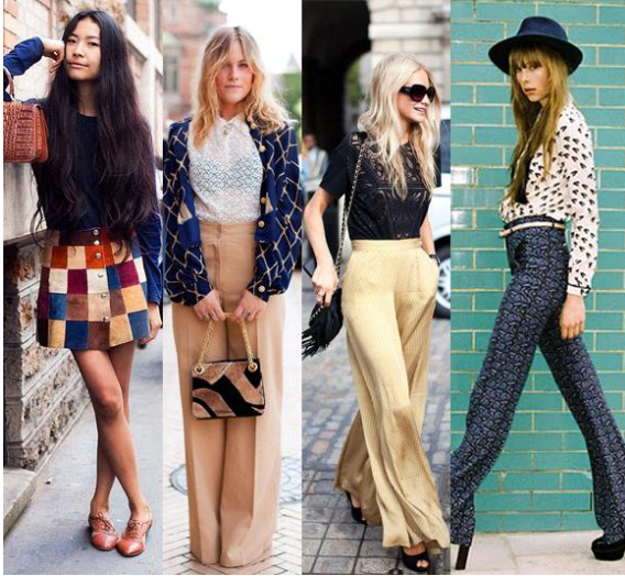
7.2 Formatos e cores da moda anos 70