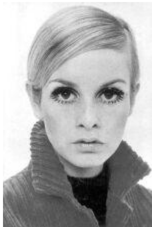
6.1 Twiggy, rosto dos anos 60.