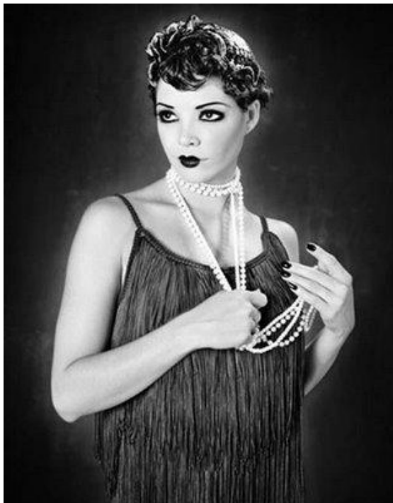
2.2) Maquiagem com olhos bem marcados, batom vermelho em formato de coração e colares compridos de perola, eram tendência nessa época.