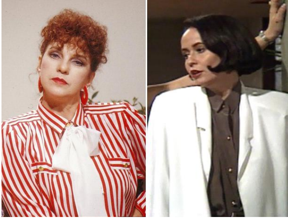
8.2 Roupas utilizadas em figurino de novelas nos anos 80