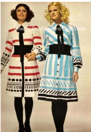
7.1 Modelagem do vestuário, e cabelos anos 70