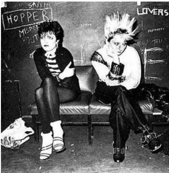
7.3 Movimento punk anos 70

8.Exemplos de moda e padrão de beleza nos anos 80.